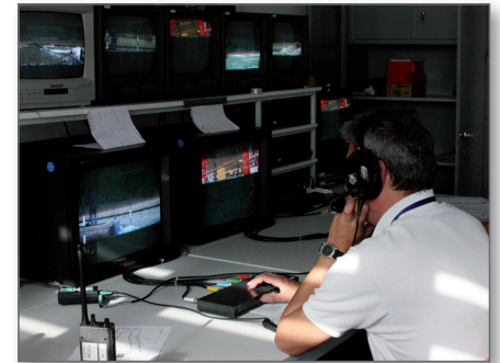
Analysepersonnel im Kanupark Markkleeberg

zwei oder drei andere Länder – selbst Top-Nationen wie Tschechien oder die Slowakei haben das nicht. Bei den vorolympischen Wettbewerben von London haben die IAT-Experten ebenfalls wichtige Daten gewonnen und eine umfangreiche Wettkampfanalyse durchgeführt. Solche Informationen für bestimmte Streckenabschnitte oder Kombinationen können dann vor den wichtigen Rennen problem-